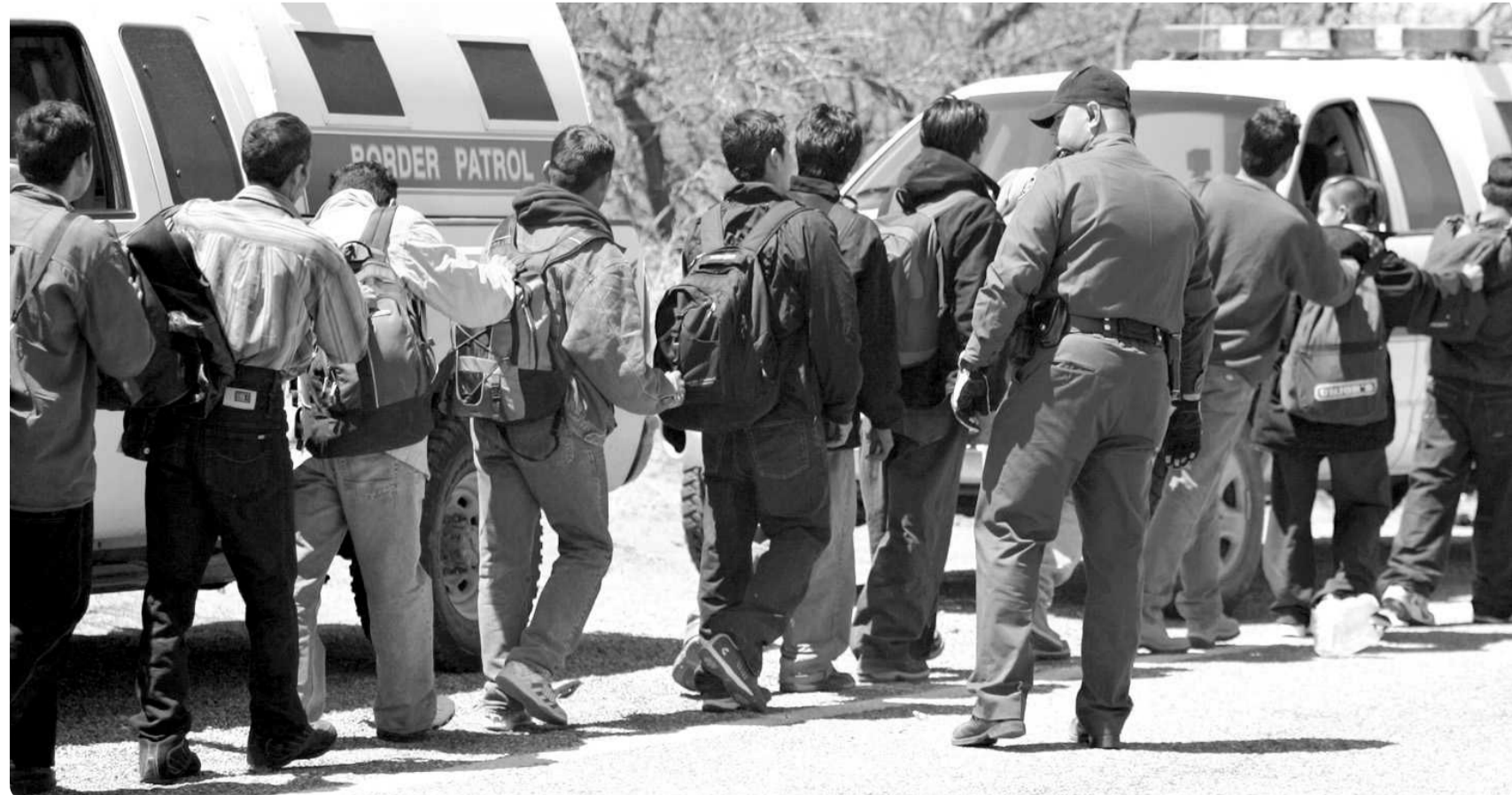
A últimas fechas, el número de personas que son deportadas por esta frontera ha disminuido drásticamente.

La poca movilidad de personas que buscan el “sueño americano” se puede medir también con el estrepitoso descenso en el número de deportaciones.